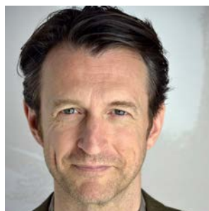
STÉPHANE CRÊTE Comédien Metteur en scène